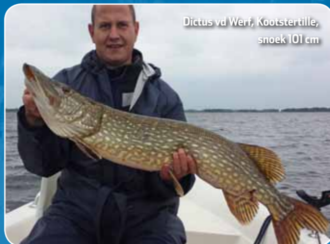
Dictus vd Werf, Kootstertille, snoek 101 cm