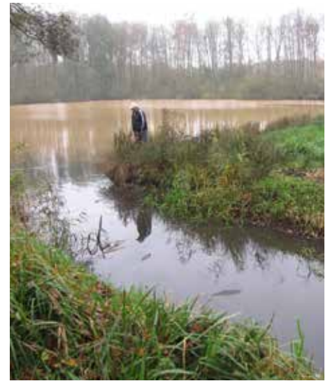
Vissterfte in Bekhofplas? Gelukkig hoeft het VCT niet in actie te komen.

Dan is wellicht een vrijwilliger functie als lid van het Viscalamiteitenteam iets voor jou. We zullen je als lid van het provinciaal team voorzien van een (korte) opleiding, zodat je in het veld kan inschatten wat de beste oplossing is voor de calamiteit. Het team komt in actie als er in een water flauwe vis wordt aangetroffen of de vis op een andere manier wordt bedreigd. Zo kan het gaan om situaties met een riooloverstort, perioden met warm weer, een extreem hoge water afvoer of 's winters als ijs en sneeuw het water afdekt. Ook