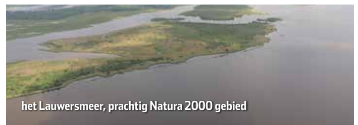
het Lauwersmeer, prachtig Natura 2000 gebied

Met nadruk laten wij weten dat het onderzoeken van vistuigen is voorbehouden aan aangewezen toezichhouders dan wel opsporingsambtenaren. Op dit moment is het zo dat er ook personen zijn die menen zelf de fuiken te moeten gaan lichten om een onderzoek in te stellen. Sportvisserij Fryslân keurt dit ten