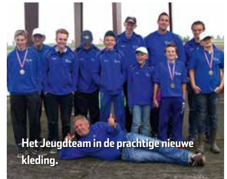
Het Jeugdteam in de prachtige nieuwe kleding.

Voor de volledige uitslag en enkele foto's kun je kijken op de site van Sportvisserij Fryslân; www.visseninriesland.nl