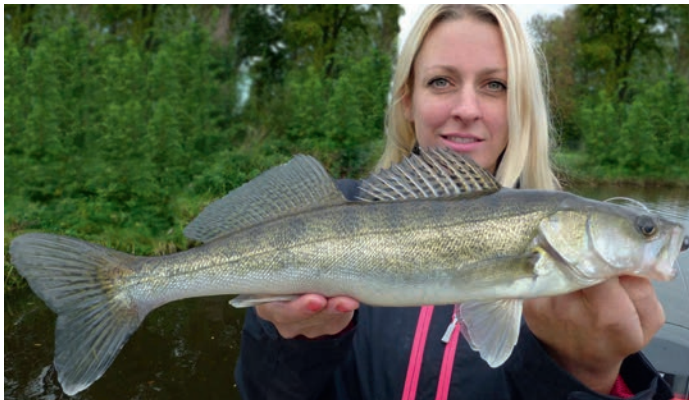
Een snoekbaars die zich hard aan een kolbleitje vergreep op 1,6 meter diepte na een warme dag, net voor het onweer.

Zelfs als kunstaasvisser in hart en nieren ben je weleens "kunstaas moe". Vooral in de hete zomer dagen als de snoekbaars ook passief blijkt te zijn. Vaak zijn 'de stekels' dan beter met een fireball en een 'dood aasvisje' te verleiden. Het kolbleitje is naar mijn mening hiervoor het beste aas. In de periode wanneer de pos goed te vangen is, blijkt dit aasvisje uiteraard ook een topper.