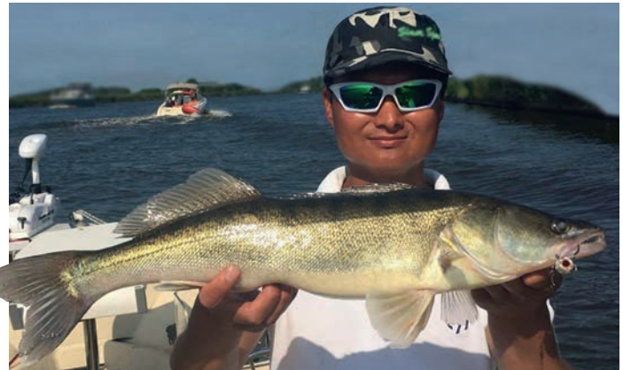
Een mooie snoekbaars tegen de beschoeiing gevangen toen het de 30 graden was.

Meestal pakt de snoekbaars het aasvisje bij de kop en kun je vrijwel direct aanslaan. Je zou de snoekbaars ook 's nachts of in de zeer vroege ochtenduren kunnen belagen maar, op beide tijdstippen