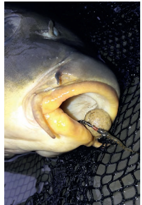
De lengte van de onderlijn per seizoen is belangrijk voor de juiste inhaking

Beide willen we uiteraard voorkomen omdat we de vis met zo weinig mogelijk beschadigingen terug willen zetten.