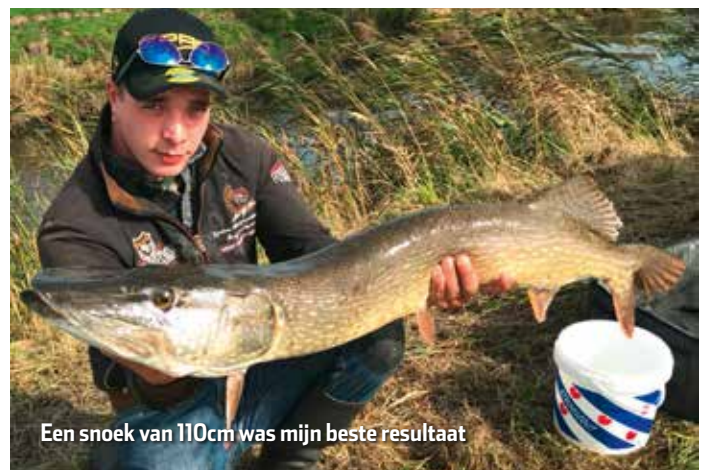
Een snoek van 110cm was mijn beste resultaat

Maar tijdens het penvissen op karpers waar mijn voer uit maïs, pellets en schapen brokken bestaat, kwam ik er achter dat er veel schoolvis op af kwam. regelmatig zag ik springend aasvis en dikke kolken op de stek. Daarom dit najaar besloten ook met schapen brokken en pellets te voeren zodat er aasvis op de stek zou komen want waar de aasvis gaat, volgt de snoek ook, dat was mijn gedachten. En het pakte verbazingwekkend goed uit; met deze manier heb ik dit najaar al verschillende mooie snoeken gevangen. Daarvan zaten een aantal hoge 90ers bij en heb ik ook enkele meter snoeken weten te vangen. Zo zie je maar dat een vreemde manier ook een goeie manier kan zijn.