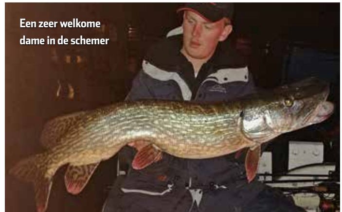
Een zeer welkome dame in de schemer

degelijke reel met gevlochten lijn en als onderlijn een zelf gemaakte stalen onderlijn. Met deze hengels vis ik kunstaas van 10 tot 50 centimeter.