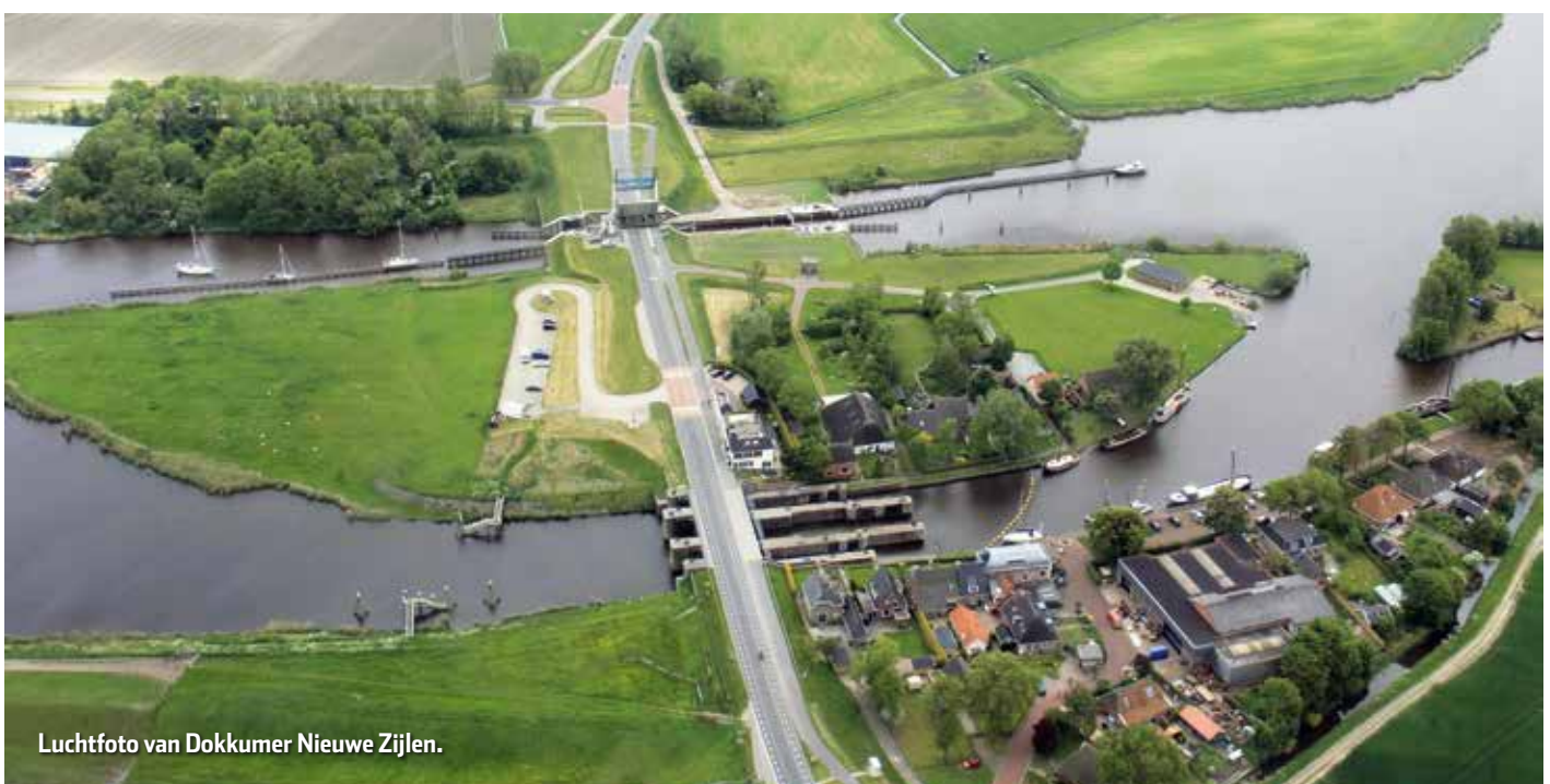
Luchtfoto van Dokkumer Nieuwe Zijlen.

Natuurlijk kun jij je hier ook aanmelden om eenvoudig deel te nemen aan activiteiten.