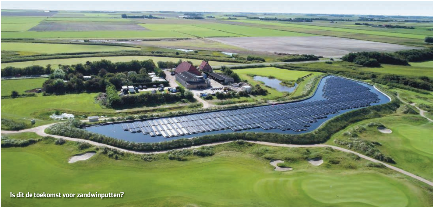
Is dit de toekomst voor zandwinputten?

Het blijkt dat er steeds vaker plannen zijn om grote delen van plassen, die nu nog dienst doen als viswater, te verkopen aan bedrijven die er duurzame groene energie wil gaan exploiteren. Soms wordt echter aan een project de term 'groen' of 'duurzaam' gehangen, terwijl je daar met gezond boerenverstand toch je twijfels bij kunt hebben.