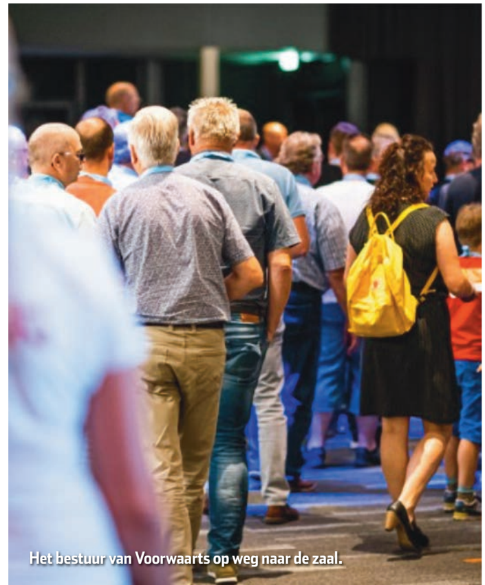
Het bestuur van Voorwaarts op weg naar de zaal.

Daarnaast werd er door enkele bestuursleden een workshop gevolgd om mogelijkheden te vinden om meer jeugd naar de waterkant te trekken. Verder hebben we informatie ingewonnen over "de Harkboot" die veel effectiever de overtollige waterplanten kan verwijderen dan de huidige maaiboten en bovendien blijft de vegetatie ook langer weg is de ervaring.