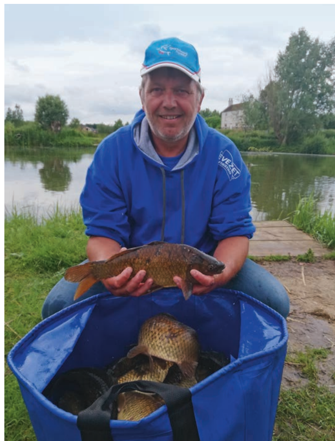
Gooitzen met de dagvangst