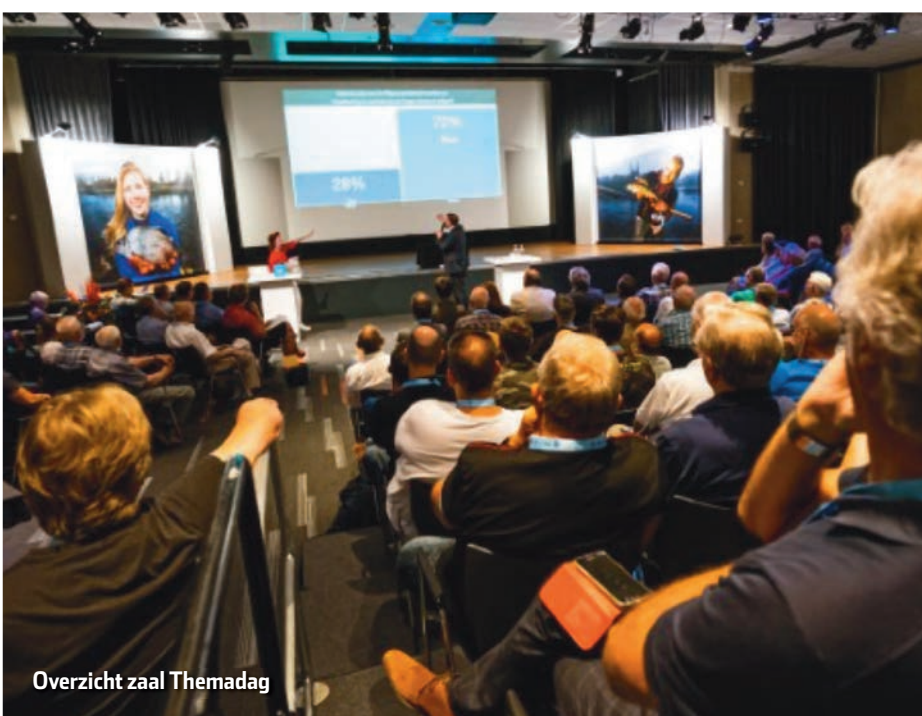
Overzicht zaal Themadag

Op de terugweg hadden we nog een kleine bestuursvergadering in de auto, dus al met al was het een nuttige zaterdag.