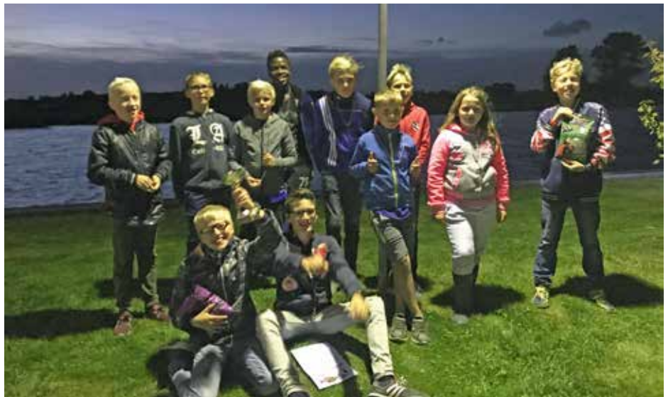
De deelnemers aan de visclinic

Dit jaar hebben we weer allerlei mooie activiteiten kunnen organiseren. Voor de competitie zijn er 8 wedstrijden gevist. Daarnaast hebben we een clubkampioenschap, een koppelwedstrijd, scholen viswedstrijd en clinics georganiseerd. Tijdens de clinics van 3 avonden in september zijn er veel dingen geleerd. De eerste avond theorie, de tweede avond gingen we de theorie nabespreken en een tuigje maken. De derde avond gingen we dan eindelijk met de jeugd en hun gemaakte tuigje vissen bij Paviljoen Driewegsluis in Nijetrijne. Hier werd door iedereen vis gevangen. Was heel leuk om te zien hoe de jeugd aan het vissen was. Jammer was dat het heel gauw donker werd, maar anders gingen ze door. Iedereen kreeg een diploma voor men naar huis ging. Voor het aankomende jaar zoeken wij nog vrijwilligers die ons willen helpen met het begeleiden van onze jeugdige vissers. Zij vissen met vaste stok, maar als je denkt: ik kan goed matchen of een andere visserij, stuur ons een mail. Wanneer