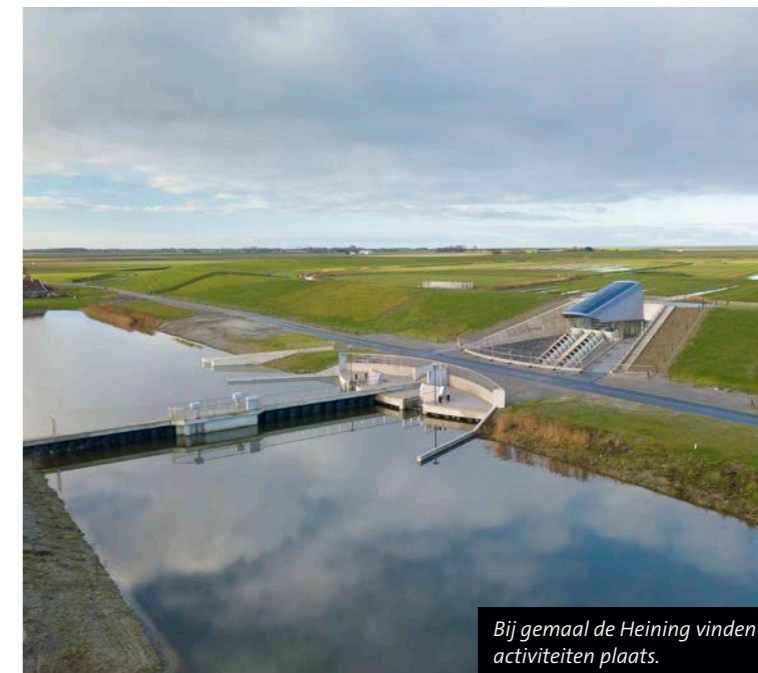
Bij gemaal de Heining vinden activiteiten plaats.

Meer info: kijk op de site van Wetterskip Fryslân, www.wetterskipfryslan.nl .