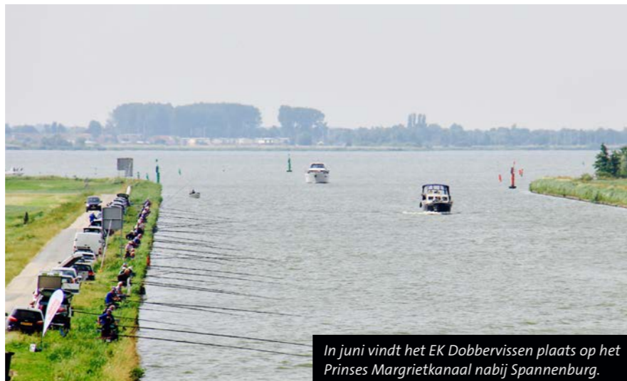
In juni vindt het EK Dobbervissen plaats op het Prinses Margrietkanaal nabij Spannenburg.

Wie zich als vrijwilliger wil aanmelden kan mailen met wedstrijden@sportvisserijnederland.nl ; of bellen dan wel mailen met 0566-624455, info@visseninfriesland.nl .