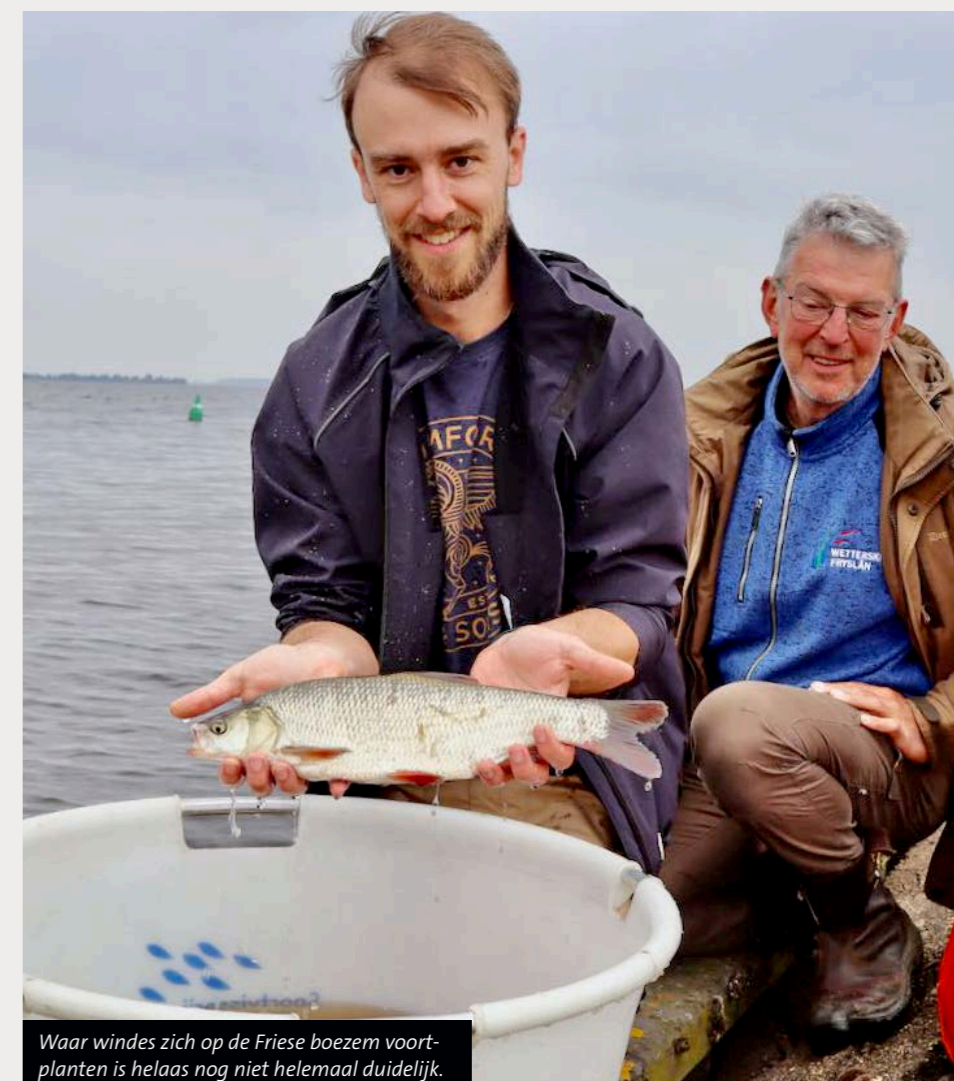
Waar windes zich op de Friese boezem voortplanten is helaas nog niet helemaal duidelijk.

Afgelopen jaar zijn in alle vier de in- en uitgangen van het Tjeukemeer – én op de belangrijkste splitsingen van en naar de rivieren de Linde en de Tjonger – ontvangers in het water geplaatst. Met behulp van Pascal Sannes, de beroepsvisser op het Tjeukemeer, hebben we de eerste windes kunnen vangen en die voorzien van een zender. Na het uitlezen van deze zenders in februari, de zogenoemde hydrofoons, bleek al snel dat twee windes na het zenderen op meerdere uitgangen van het meer zijn waargenomen en begin dit jaar richting het westen van het Tjeukemeer, de Follegasloot, zijn getrokken. Of ze vervolgens door zijn gegaan richting de Grutte Brekken, of misschien zelfs het IJsselmeer, is nu nog onbekend. In 2024 gaat het onderzoek verder en proberen de onderzoekers meer windes te gaan volgen. Dit begint dit voorjaar bij de visserij op de Linde en Tjonger. De onderzoekers 'verzoeken vriendelijk' aan iedere sportvisser die een winde in het Tjeukemeer vangt, of in aangrenzende wateren, die vangst te melden via winde@visseninfriesland.nl .