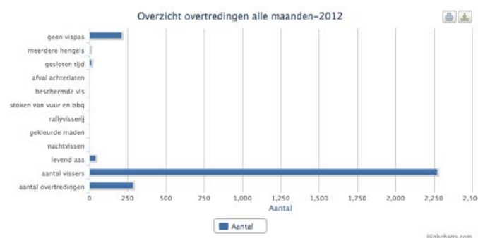
Figuur 2: Aangetroffen overtredingen door controleurs