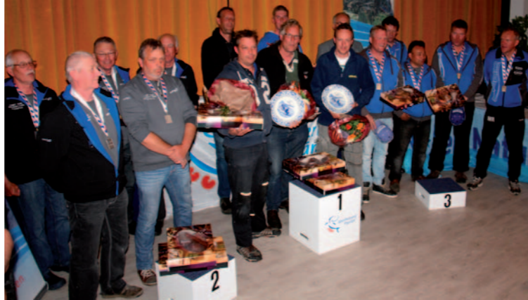
Foto de kampioenen: vlnr Korps de Rietvoorn (2e plts), de Tjonger (1 plts), de Oanslach 2 (3 plts)

De deelnemers en organisatie kijken terug op een zeer geslaagd evenement; 92 deelnemers op een schitterend, klassiek wedstrijdwater met gelijke kansen voor iedereen, uitstekende vangsten, resulterend in tevreden sportvissers en een terechte winnaar.